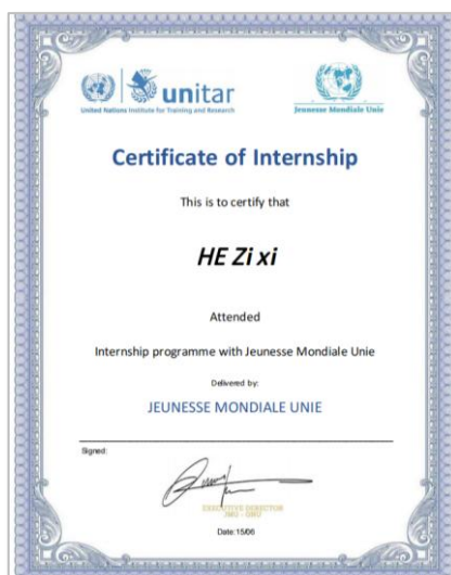
项目实习证明（样例）