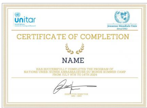
项目结业证书（样例）