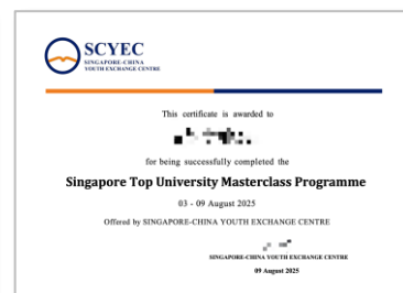
项目结业证书 (样例)