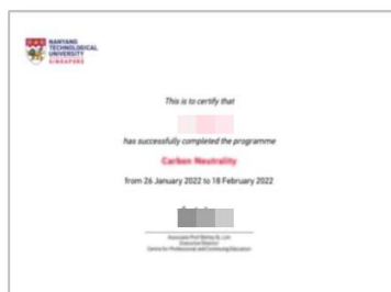
项目结业证书 (样例)