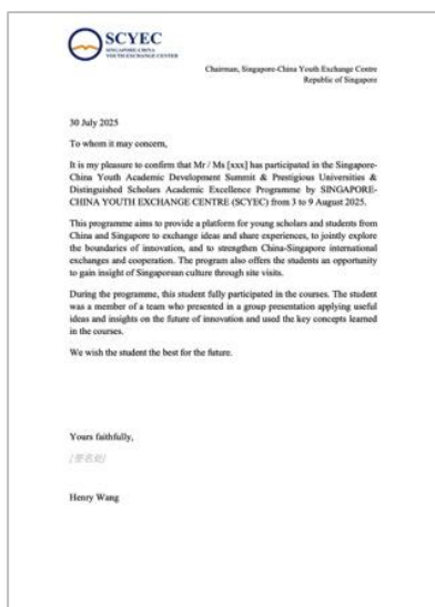
项目组推荐信(样例)

https://scale.nus.edu.sg/home/youth/nus-youth-programmes-faqs