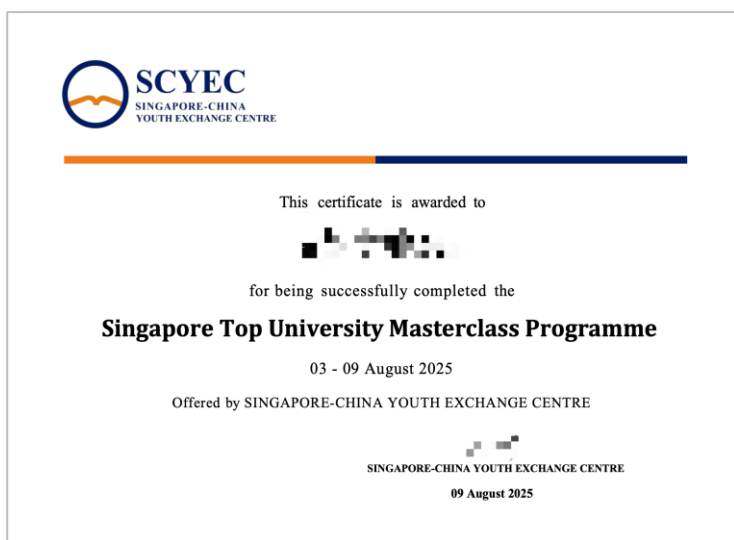
项目组结业证书 (样例)