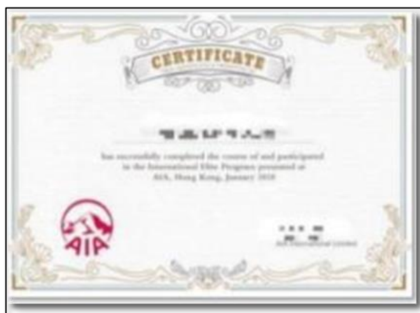
香港实习证明（样例）