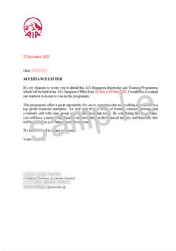
项目结业证书 (样例)