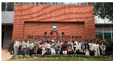
参访交流：香港大学