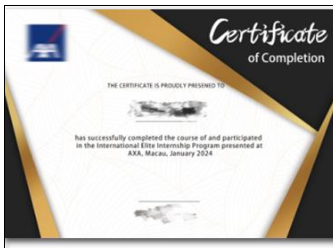
澳门实习证明 (样例)