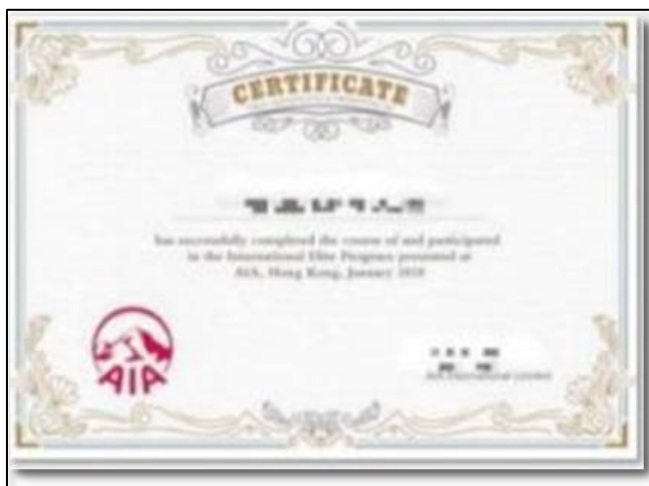
香港实习证明 (样例)